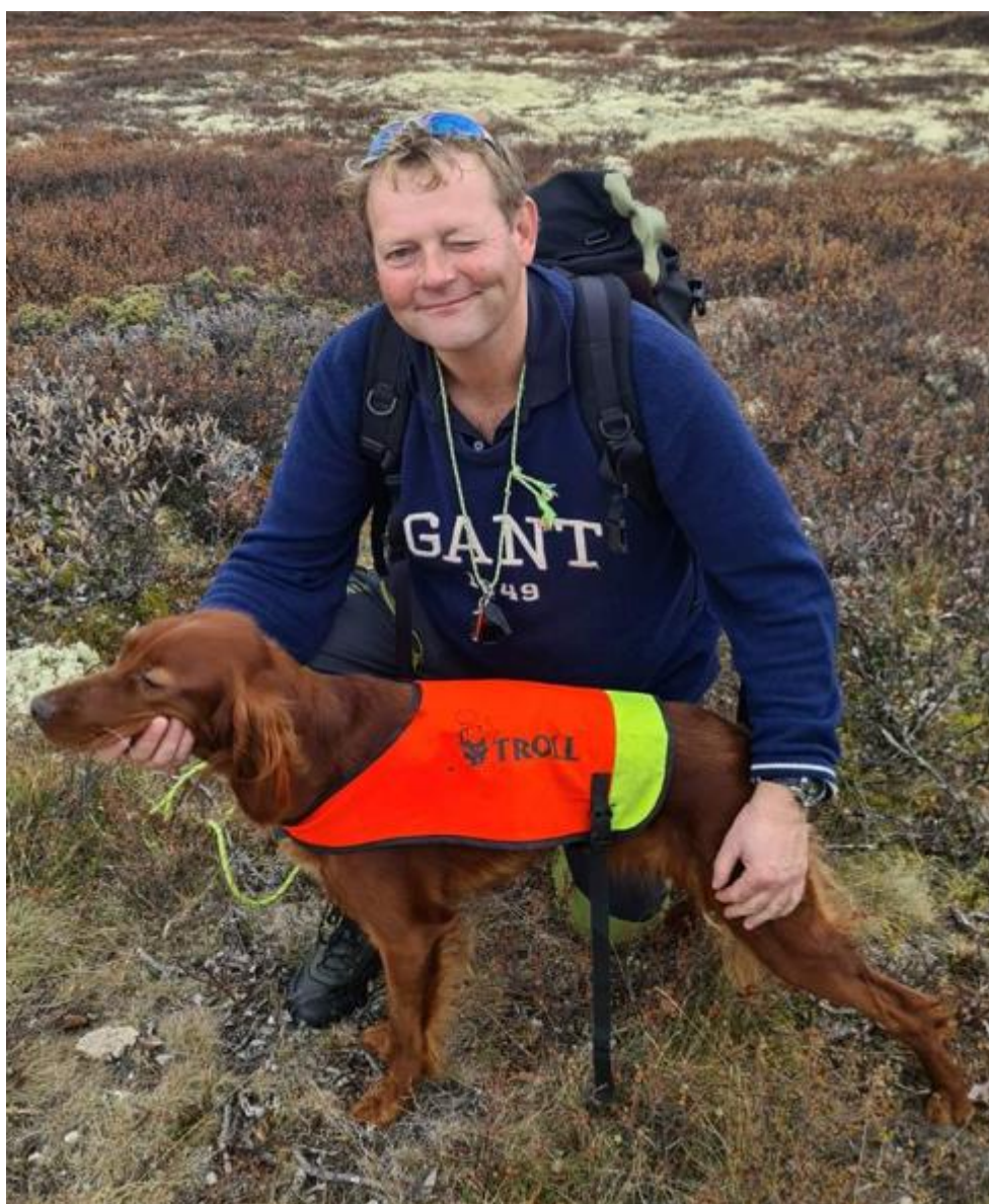
Norsk Derbyvinner 2021 og Årets Klubbhund HVFK 2021